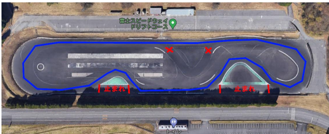
ドリフトコース：ストレート 上級・中上級